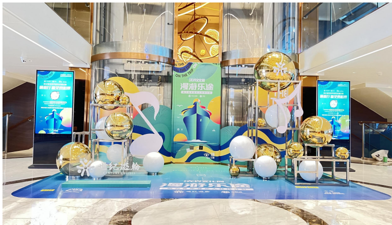
① 荣耀级游轮一楼大厅 美陈点: 5x3x2.5m