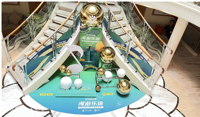
①神话传奇一楼大厅美陈点 高度：2.5m 地面弧形区域：3.9x2.7m