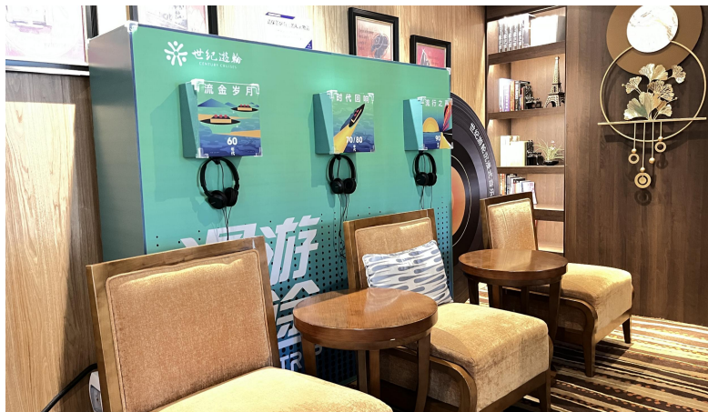
②神话传奇体验点：6楼阅览室