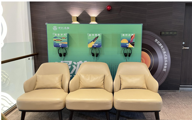
② 荣耀级游轮体验点: 3、4楼休息区